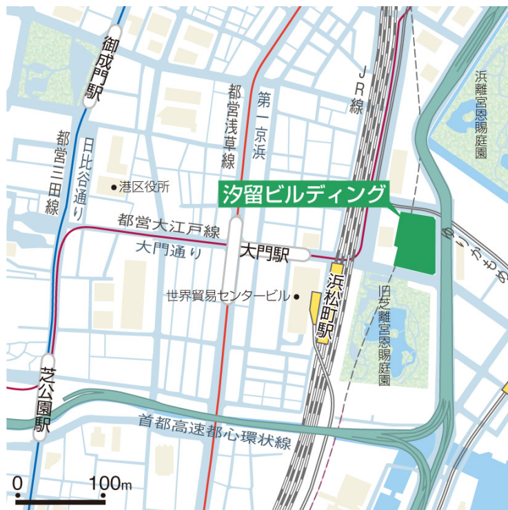
(参考) 汐留ビルディング 案内図、外観写真