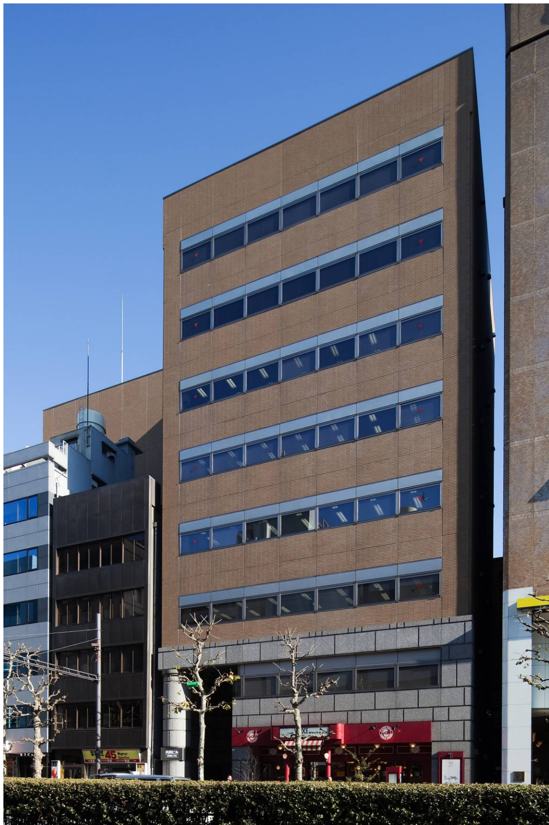
(参考) 共同ビル (茅場町2丁目) 外観写真