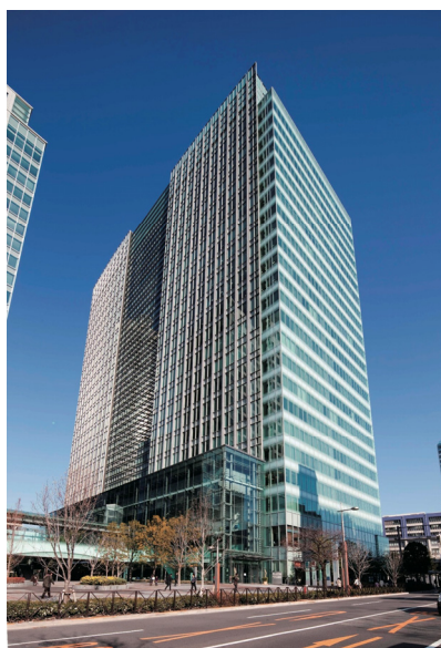
汐留ビルディング 外観

本認証の取得を背景に、2017年2月28日付け「国内不動産及び国内不動産信託受益権の取得に関するお知らせ」にてお知らせしました、汐留ビルディングに係る信託受益権の準共有持分 5%の追加取得資金の一部に充当することを目的として、DBJ Green Building 認証付私募債として本投資法人債を発行するものです。