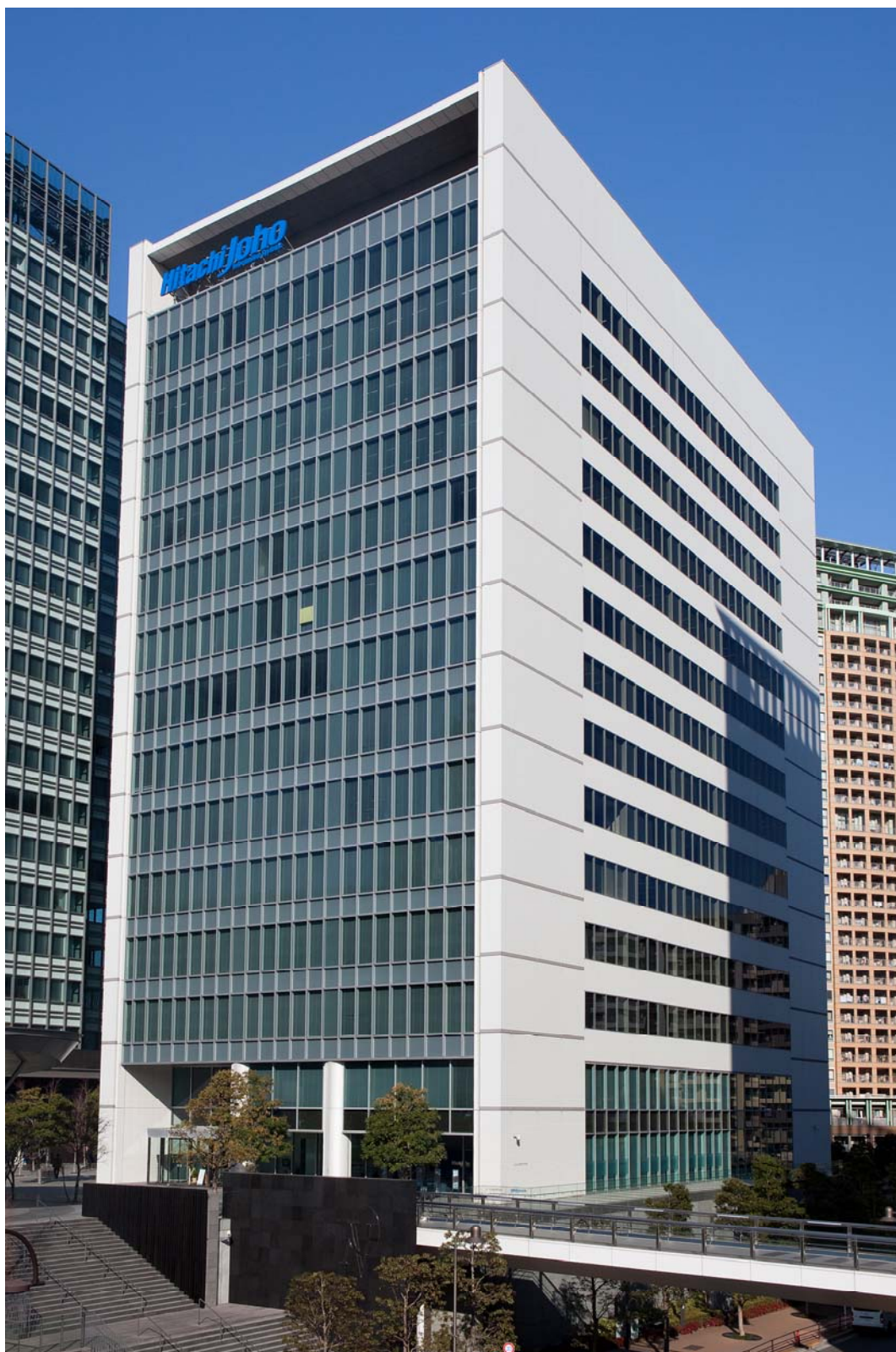
(参考) 大崎フロントタワー外観写真